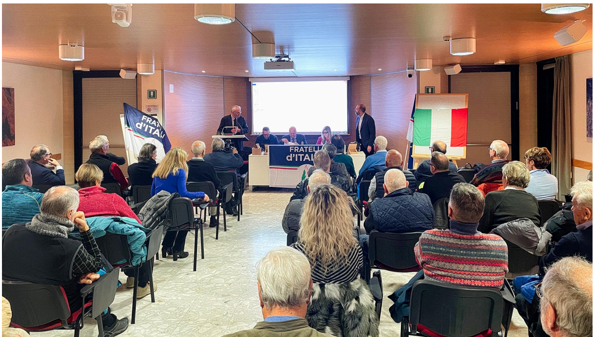
Bürger*inneninformation CESFAM, Paluzza